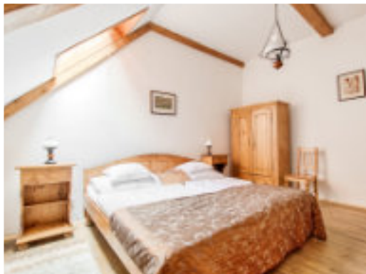
pokoj Classic Plus

Možnost rozdělení postelí pouze pokoj Classic.