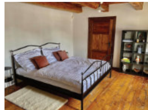
apartmán U Tížků

Ubytování ve stylovém apartmánu U Tížků. Jedná se apartmán pro 2 osoby vybavený manželskou postelí, menší kuchyňkou, jídelním stolem, příruční ledničkou a koupelnou s rohovou vanou.